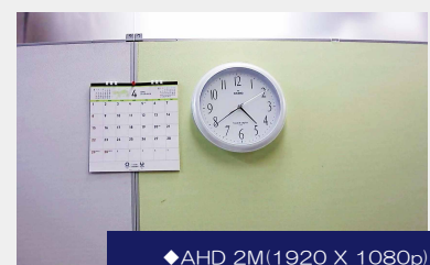
◆ AHD 2M(1920 X 1080p)