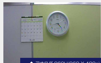
◆ アナログ 960H(960 X 480p)